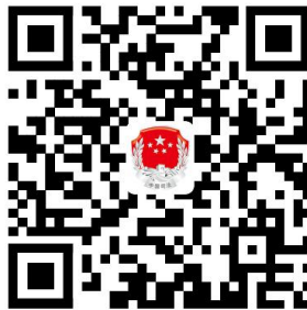
基层法律服务工作者执业许可