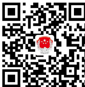
基层法律服务所的注销登记