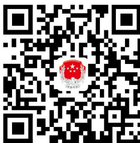
基层法律服务工作者注销许可